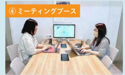
④ ミーティングブース

最大6人までの打ち合わせなどに使える会議室。大画面モニターにお持ちのパソコンをつないで資料の共有やオンライン会議も快適にできます。