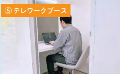
⑤ テレワークブース

気軽な打ち合わせに使える、ドアがない6席の個室。小さめのテーブルで距離もグッと縮まります。ドロップイン利用でもおすすめ。