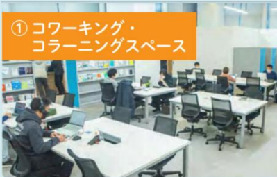
① コワーキング・ コラーニングスペース

天井が高く広々とした明るい空間に約110席をご用意。Wi-Fiや電源はもちろん、プレストなどで重宝するホワイトボードも利用できます。