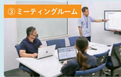
③ ミーティングルーム

大画面モニターやカメラ、マイクなどの機器が揃っていて、お持ちのパソコンとTV会議ツールを設定するだけでオンライン会議を始められます。